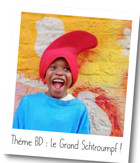
Thème BD : le Grand Schtroumpf !