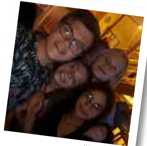
Veillée - Session août 2020

J'ajouterais que les difficultés rencontrées par nos participants seront d'autant plus faciles à comprendre quand elles seront plus tard exprimées par les enfants. S'ils ne vivaient pas cette expérience avant d'aller animer les bouts de choux, comment pourraient-ils les accompagner dans cet exercice périlleux ?