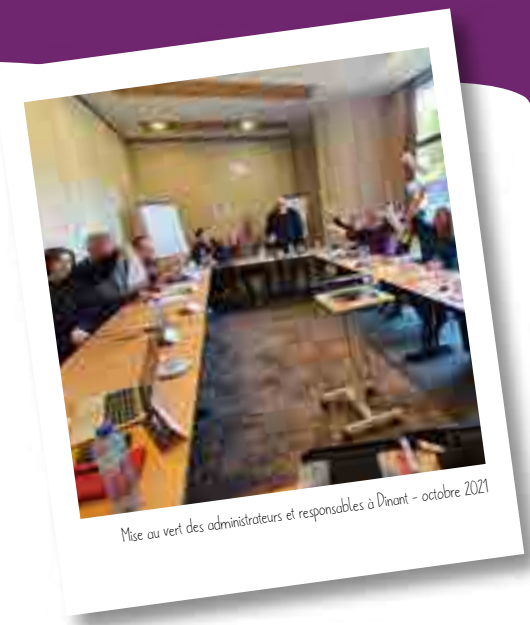
Mise au vert des administrateurs et responsables à Dinant - octobre 2021

Au final, nous avons constaté que nos mises au vert résidentielles ont permis à tous de porter un autre regard sur nos activités, et d'envisager la suite de l'aventure COALA avec un regard neuf, de manière constructive et avec de nouveaux projets sous le coude. Que du bonus donc !