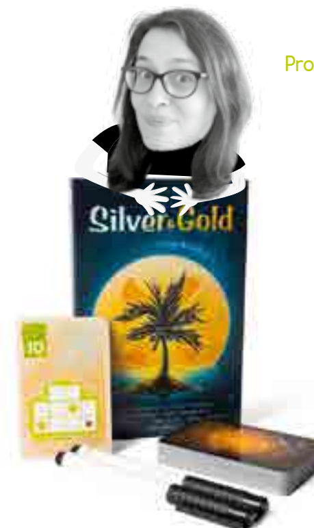
Un jeu de Phil Walker-Harding, illustré par Olivier Freudenreich, édité par Oya (2020)

Le principe : 2 à 4 joueurs s'affrontent simultanément pour explorer des îles (cocher des cases sur des cartes en fonction de blocs "Tétrisiens" - je valide ce terme) afin de les découvrir entièrement (cocher toutes les cases) et ainsi gagner les trésors cachés sur ces îles (les points indiqués en haut à gauche des cartes). Certaines cases offrent des bonus à celui qui les coche. Le joueur ayant récolté le plus de points (valeurs des trésors + points bonus) remporte la partie.