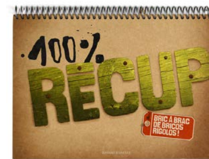
100% Récup Bric à brac de bricos rigolos ! Collectif d'auteurs Éditions BAYARD