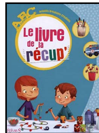
Le Livre de la Récup' Collectif d'auteurs Éditions FLEURUS