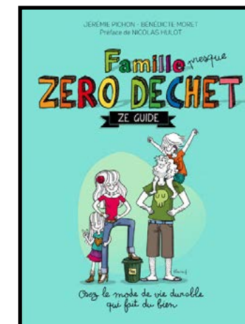
Famille presque Zéro Déchet J. Pichon et B. Moret THIERRY SOUCCAR Éditions