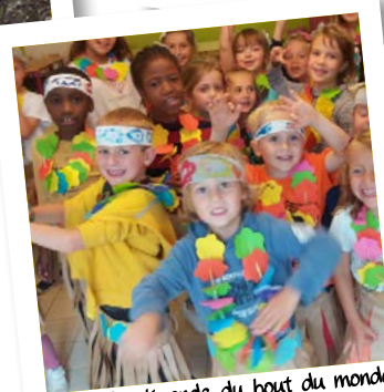
Plaine "La légende du bout du monde" Août 2017 - Profondsart