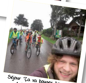
Séjour "Ça va bouger, bouger" Août 2017 - Botassart