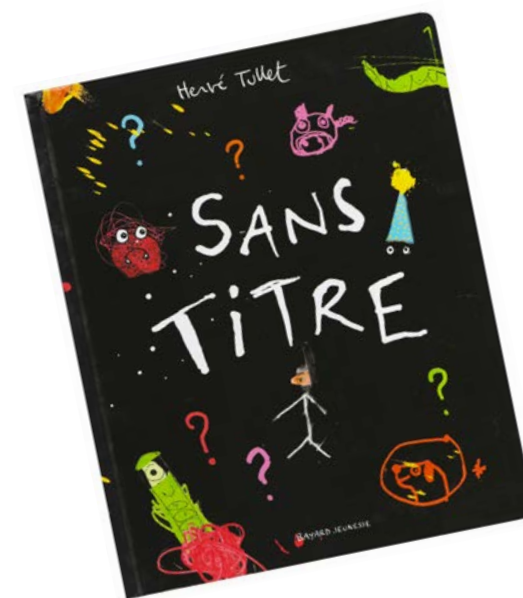
Album jeunesse de Hervé Tullet Edité par Bayard Jeunesse Dès 3 ans