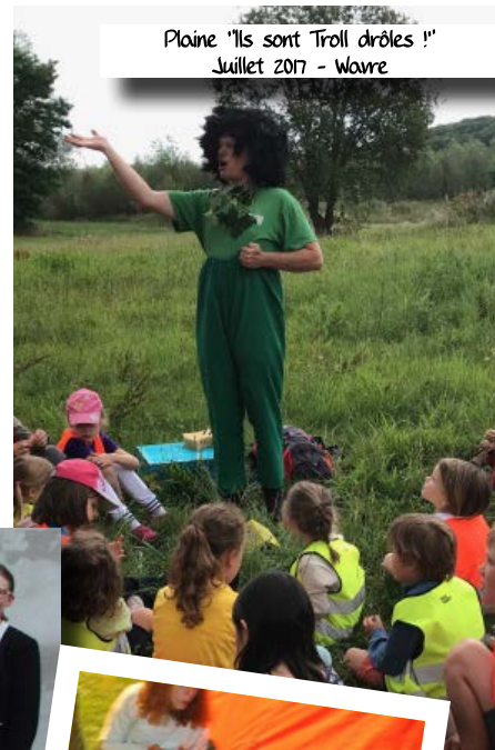
Plaine "Ils sont Troll drôles !" Juillet 2017 - Wavre