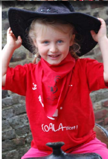
Plaine "Direction le Far West !" Juillet 2017 - Ernage