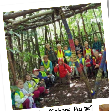
Plaine "Cabane Partie" Août 2017 Mont-Saint-Quibert