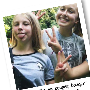
Séjour "Ça va bouger, bouger" Août 2017 - Botassart