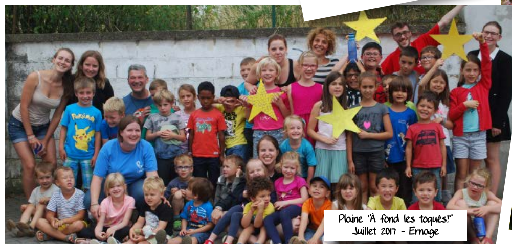
Plaine "À fond les toqués!" Juillet 2017 - Ernage